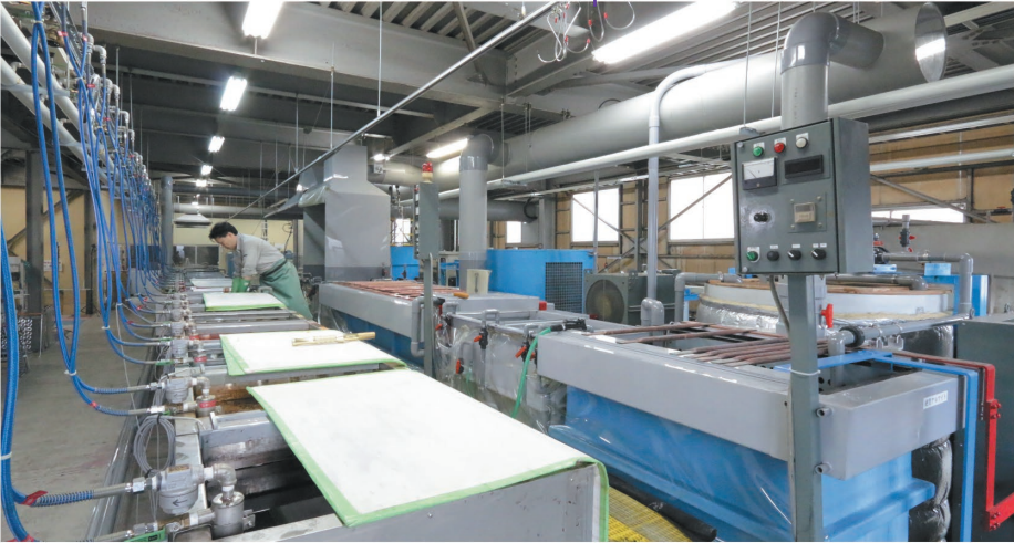
表面処理事業部工場内アルマイト処理ライン

■ アルマイト処理可能最大サイズ シルバー（白）/ ブラックアルマイト槽 500mm×1,500mm×750mm カラーアルマイト用染色槽/化学研磨槽/化学梨地槽 500mm×450mm×750mm 硬質アルマイト槽 500mm×600mm×750mm