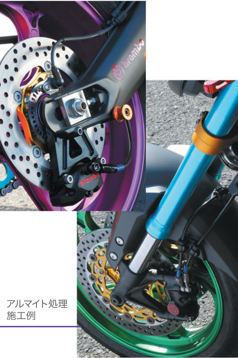
アルマイト処理 施工例