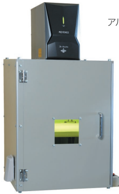
アルマイト処理+レーザーマーキング施工例