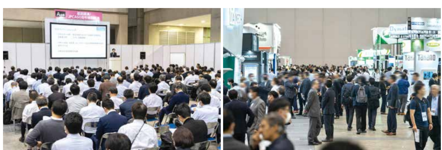
※本招待状に掲載のプログラム他は、予告なく変更となる場合がございます。予めご了承ください。講演当日は受付にご協力をお願いいたします。